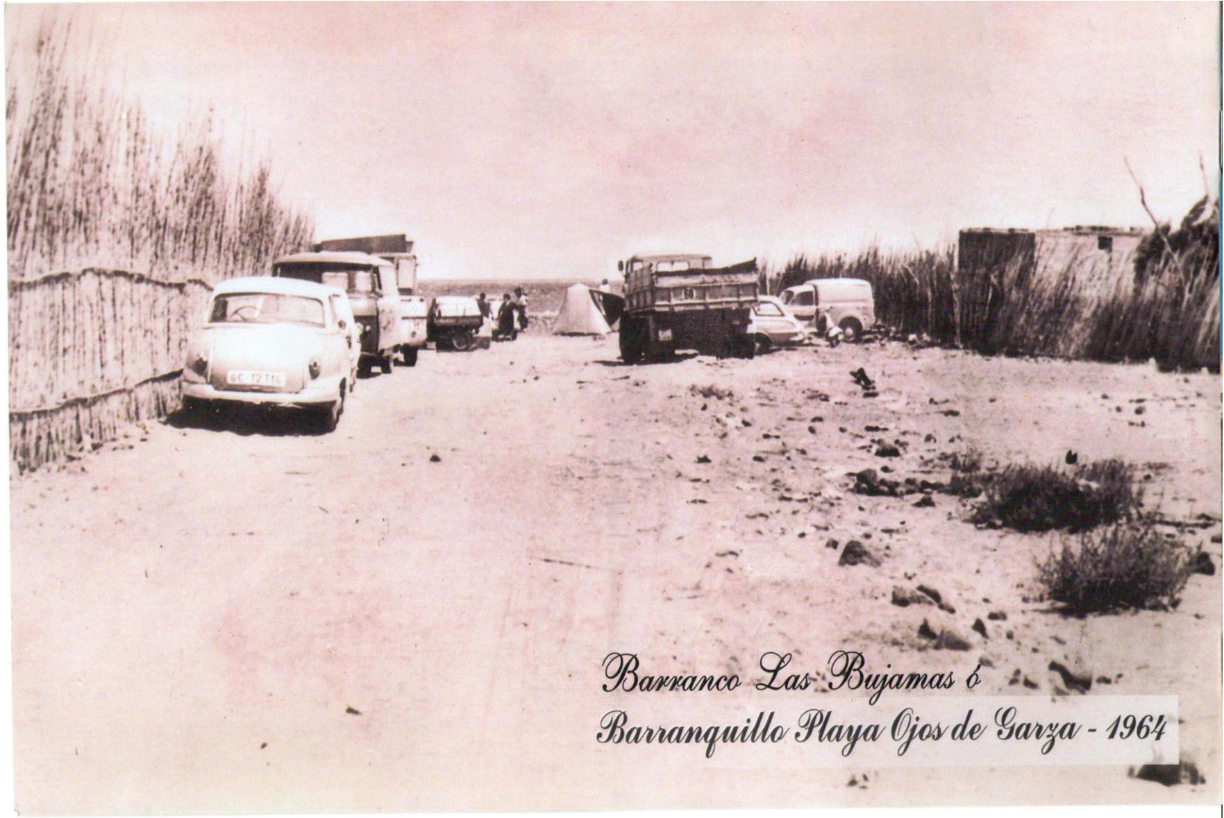
Barranco Las Bujamas ó Barranquillo Playa Ojos de Garza - 1964