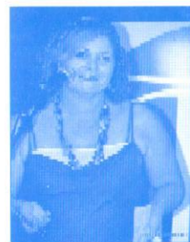
Guadalupe Santana Presentadora