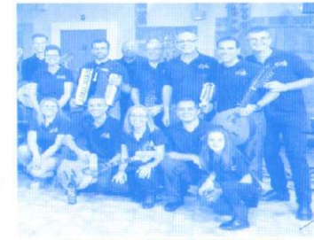
Parranda del Cura