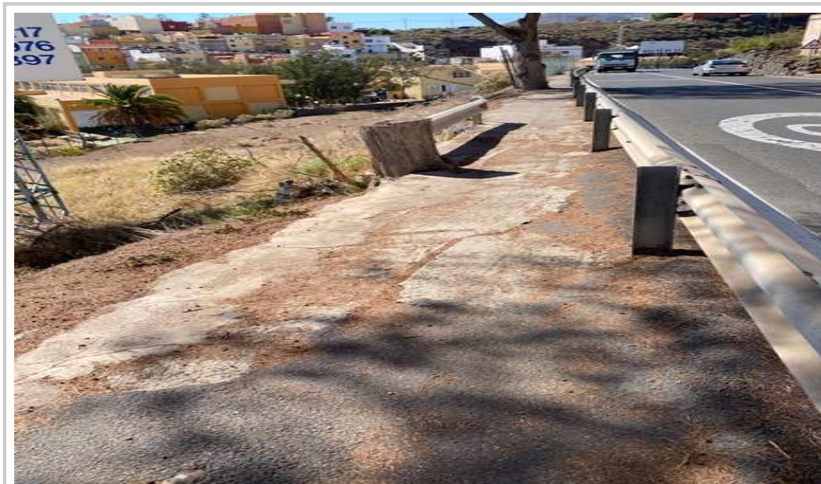
Foto 2. Acceso en mal estado, sin vallado y con arbolado que limita acceso y vallado con la carretera general