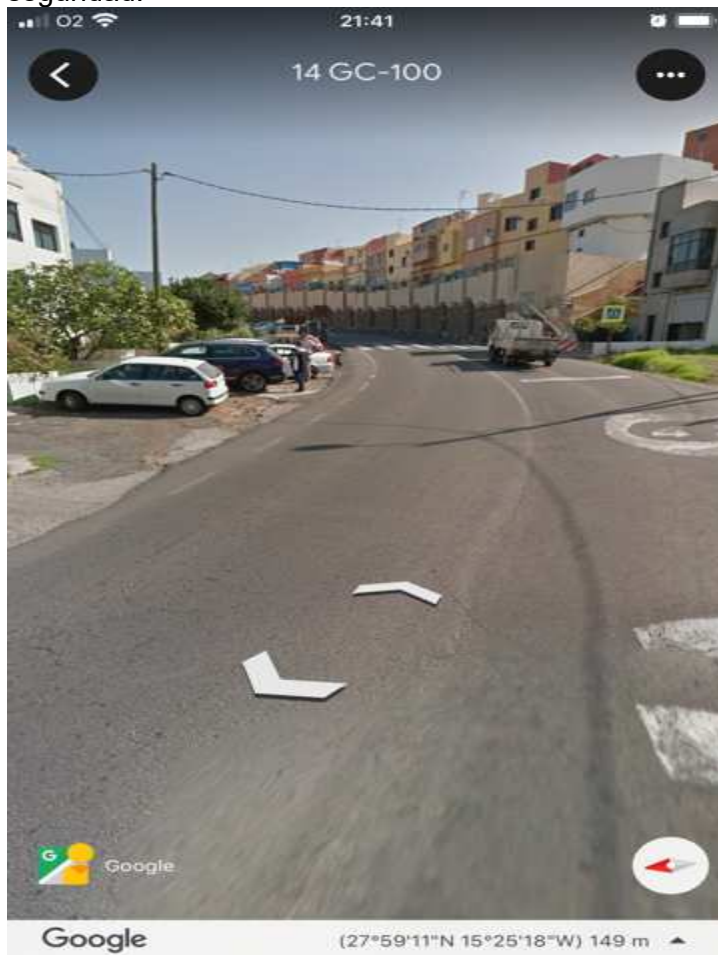
Foto 4 Paso peatonal en Lomo Cementerio

que proceden de la Barranquera. Los alumnos se ven obligados a apilonarse en el borde de la carretera debido a que el arcén en esa zona es inexistente esperando, con temor en la mayoría de ocasiones, a que los coches se detengan para cruzar con seguridad.