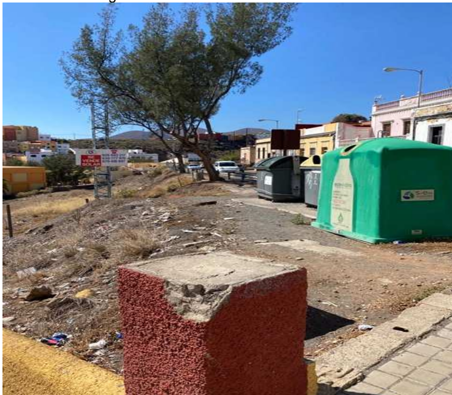
Foto 3. Depósitos de recogida de residuos y embalajes que dificultan el paso. 2º.- En cuanto al acceso por Lomo Cementerio (derecha): Este consiste en un paso de peatones justo al finalizar una curva existiendo poca visibilidad de los vehículos