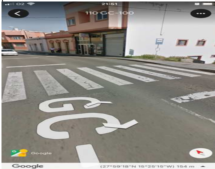
Foto 1. Paso peatonal que cruza la GC-100 en el barrio de La Barranquera.

1º.- En cuanto al acceso por la Barranquera. Además del paso peatonal que cruza la GC-100, luego el camino por donde transitan los alumnos hasta el centro educativo, en paralelo a la carretera insular, tiene un pavimento en muy mal estado y un vallado sin finalizar en buena parte del recorrido, que debería servir de protección ante posibles caídas a la ladera.