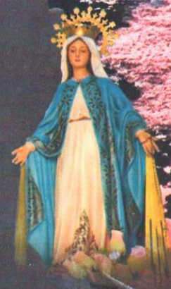
Ntra. Sra. de LA MILAGROSA

Asociación de Vecinos Unidos de la Playa de Tufia