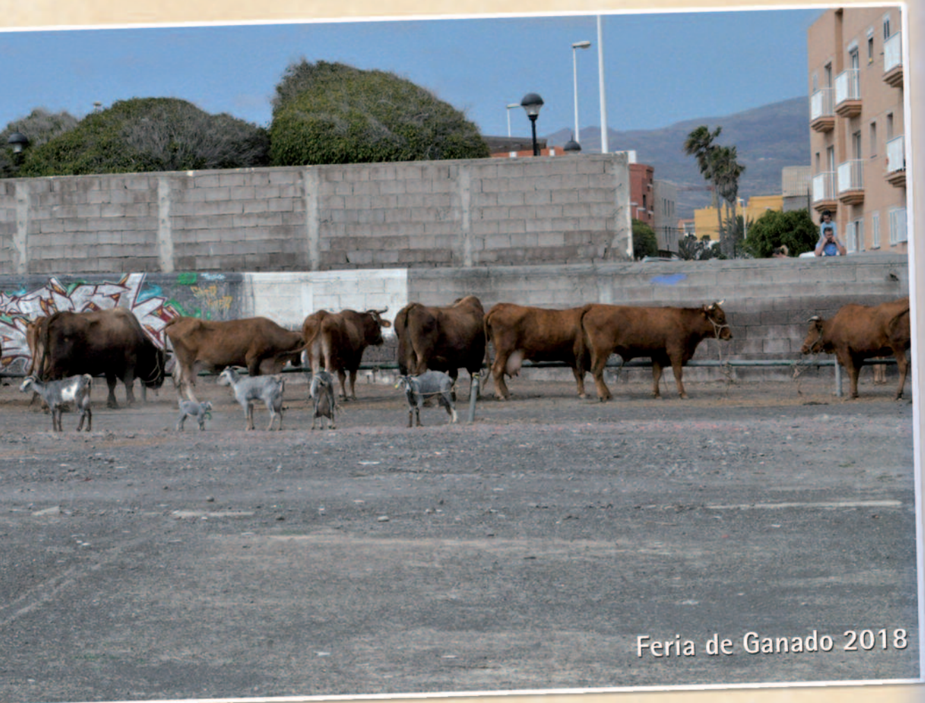
Feria de Ganado 2018