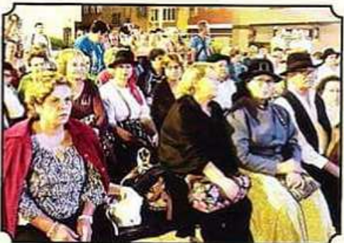
Primer encuentro de parranda "La Sal"

Actuación de niños, niñas y mayores: Espacio de creatividad y expresión.