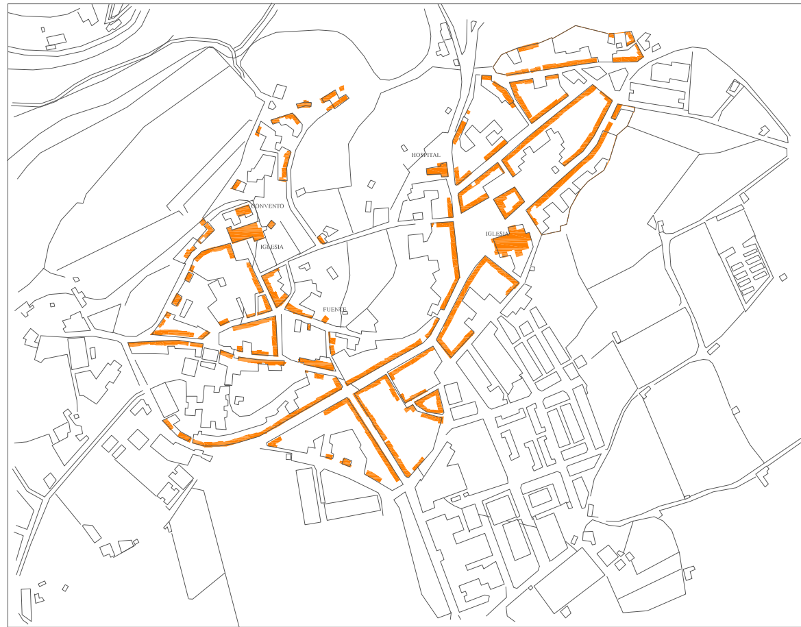
SAN JUAN Y SAN FRANCISCO EN 1590