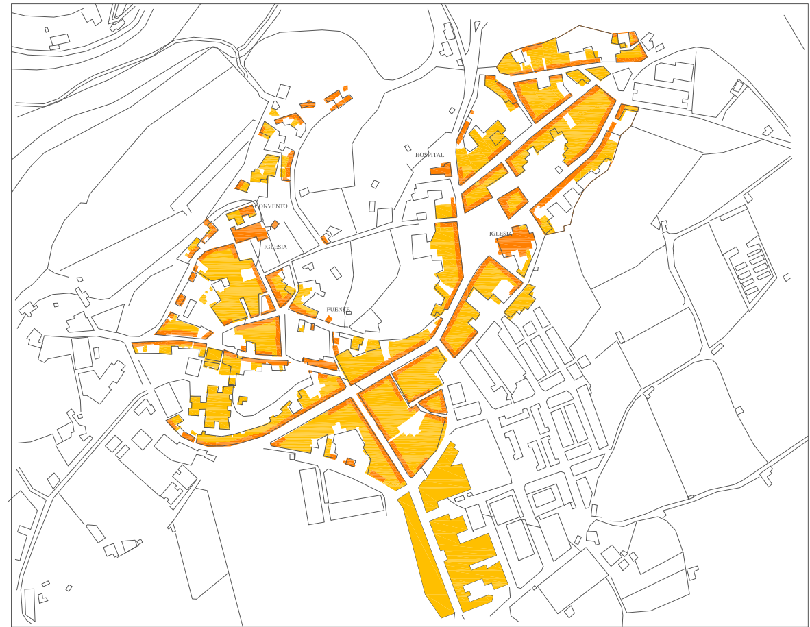
SAN JUAN Y SAN FRANCISCO EN 1960